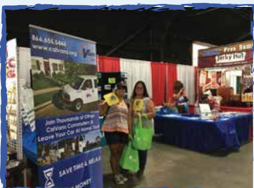
En la feria del Condado de Tulare -Tulare, Ca.