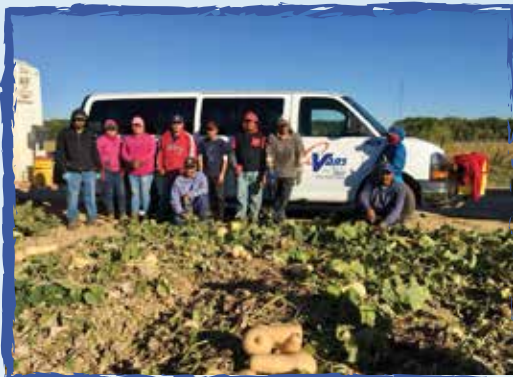
Vanpool 909 listos para la foto. -Sacramento, Ca.