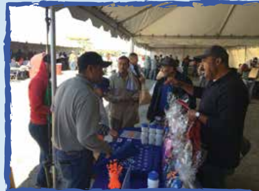
Listos para el evento! -Salinas, Ca.