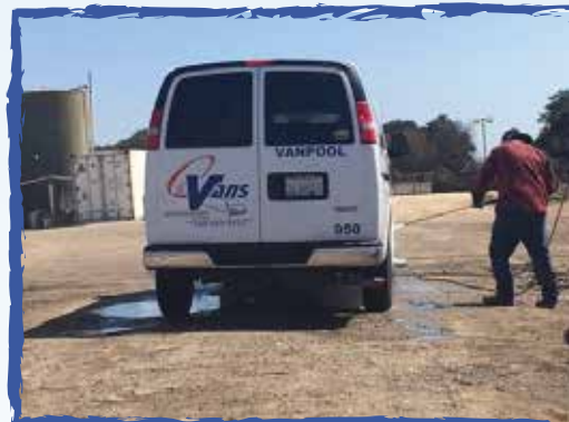
Nuestros conductores mantienen limpias sus vans. Son los mejores! -Salinas, Ca