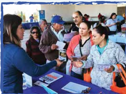
Nos encanta asistir a eventos e informar a las personas sobre los beneficios de vanpools. -Bakersfield, Ca