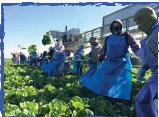
Una buena oportunidad para tomar fotos -Huron, Ca