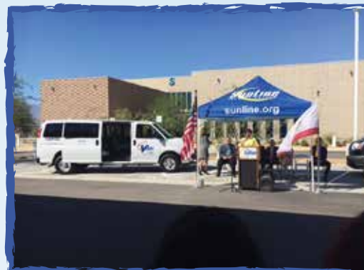
Nueva alianza con SunLine, vanpools están ahora disponibles en Riverside! -Thousand Palms, Ca