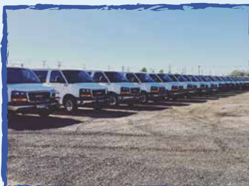
Las vans listas y limpias para la temporada -El Centro, Ca